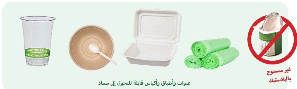
عبوات وأطباق وأكياس قابلة للتحويل إلى سماد