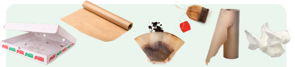
الورق والكرتون المتسخ بالطعام، وفلاتر القهوة، وقوط السفرة، وأكياس الشاي، وورق الزبدة، والمناديل الورقية، والمناديل الورقية