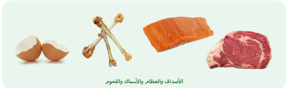
الأصداف والعظام والأسماك واللحوم