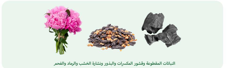
النباتات المقطوعة وقشور المكسرات والبذور ونشارة الخشب والرماد والفحم