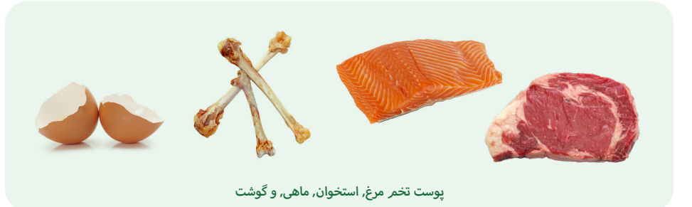
پوست تخم مرغ، استخوان، ماهی، و گوشت