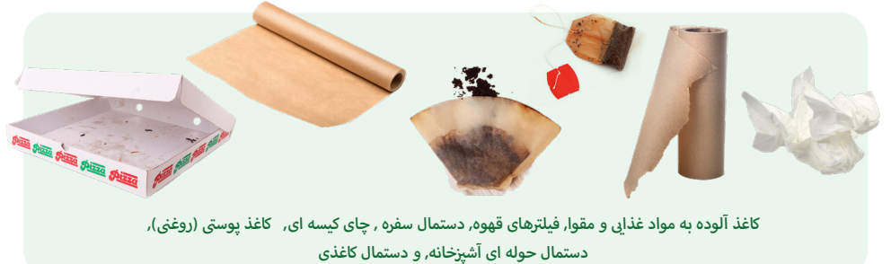
کاغذ آلوده به مواد غذایی و مقوا، فیلترهای قهوه، دستمال سفره، چای کیسه ای، کاغذ پوستی (روغنی)، دستمال حوله ای آشپزخانه، و دستمال کاغذی