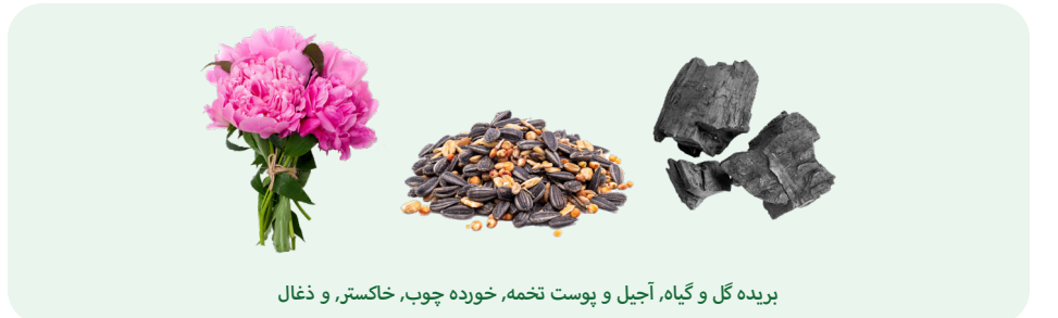
بریده گل و گیاه، آجیل و پوست تخمه، خورده چوب، خاکستر، و ذغال