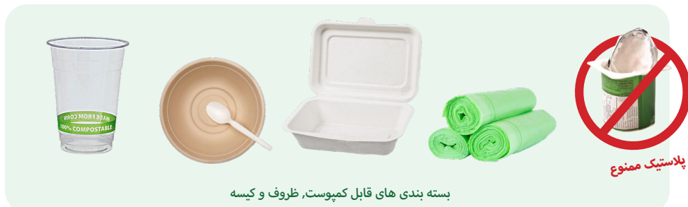
بسته بندی های قابل کمپوست، ظروف و کیسه