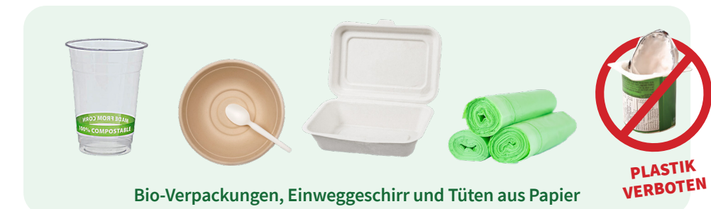
Bio-Verpackungen, Einweggeschirr und Tüten aus Papier