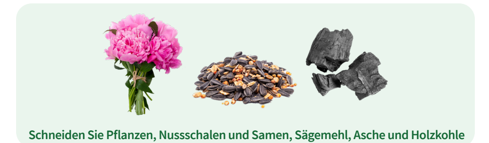
Schneiden Sie Pflanzen, Nussschalen und Samen, Sägemehl, Asche und Holzkohle