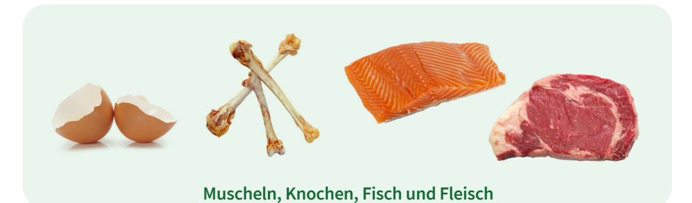
Muscheln, Knochen, Fisch und Fleisch