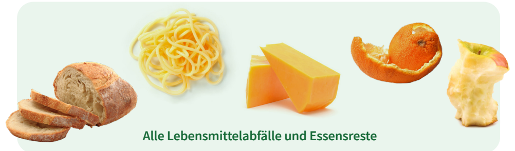
Alle Lebensmittelabfälle und Essensreste