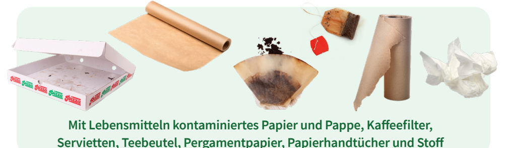
Mit Lebensmitteln kontaminiertes Papier und Pappe, Kaffeefilter, Servietten, Teebeutel, Pergamentpapier, Papierhandtücher und Stoff