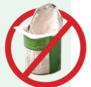
ਕੋਈ ਪਲਾਸਟਿਕ ਨਹੀਂ