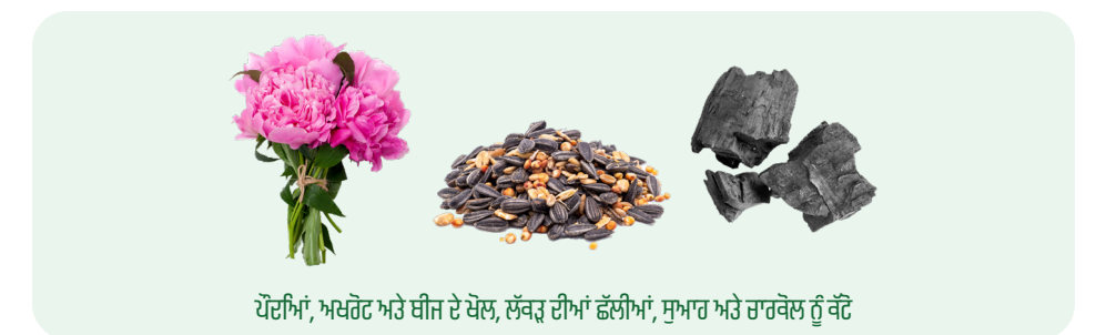
ਪੌਦਿਆਂ, ਅਖਰੋਟ ਅਤੇ ਬੀਜ ਦੇ ਖੋਲ, ਲੱਕੜ ਦੀਆਂ ਛੱਲੀਆਂ, ਸੁਆਹ ਅਤੇ ਚਾਰਕੋਲ ਨੂੰ ਕੱਟੋ