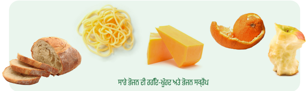
ਸਾਰੇ ਭੋਜਨ ਦੀ ਰਗੜਿ-ਖੁੰਹਰ ਅਤੇ ਭੋਜਨ ਸਕ੍ਰੈੱਪ

ਪੈਕੇਜਿੰਗ ਜਾਂ ਉਤਪਾਦ 'ਤੇ BPI ਪ੍ਰਮਾਣਿਤ ਲੋਗੋ ਦੀ ਭਾਲ ਕਰੋ। ਇਹ ਲੋਗੋ ਗਾਰੰਟੀ ਦਿੰਦਾ ਹੈ ਕਿ ਆਈਟਮ ਕੰਪੋਸਟੇਬਲ ਹੈ।