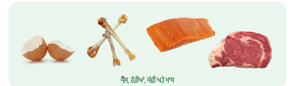
ਸ਼ੈੱਲ, ਹੱਡੀਆਂ, ਮੱਛੀ ਅਤੇ ਮਾਸ