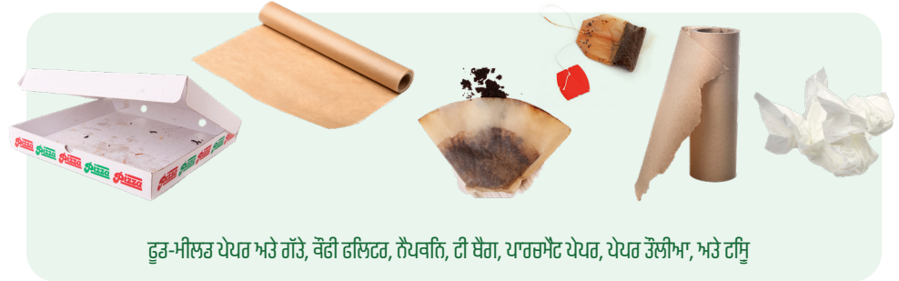
ਫੂਡ-ਮੀਲਡ ਪੇਪਰ ਅਤੇ ਗੱਤੇ, ਕੋਫੀ ਫਿਲਟਰ, ਨੈੱਪਕਨਿ, ਟੀ ਬੈਗ, ਪਾਰਚਮੈਂਟ ਪੇਪਰ, ਪੇਪਰ ਤੋਲੀਆ, ਅਤੇ ਟਿਸ਼ੂ