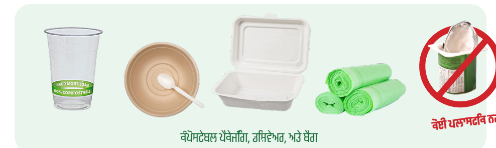
ਕੰਪੋਸਟੇਬਲ ਪੈਕੇਜਿੰਗ, ਡਿਸ਼ਵੇਅਰ, ਅਤੇ ਬੈਗ