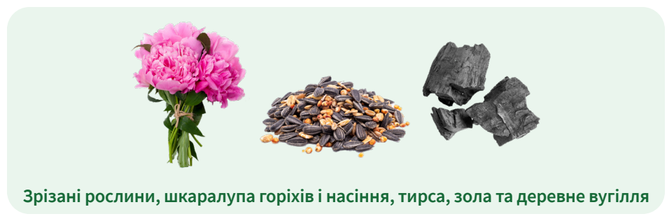
Зрізані рослини, шкаралупа горіхів і насіння, тирса, зола та деревне вугілля