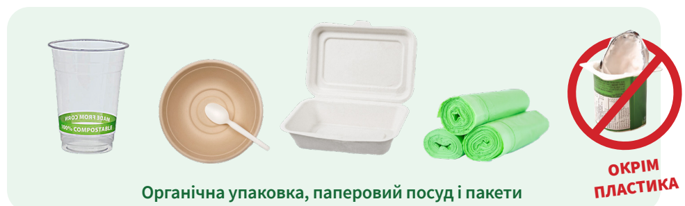
Органічна упаковка, паперовий посуд і пакети