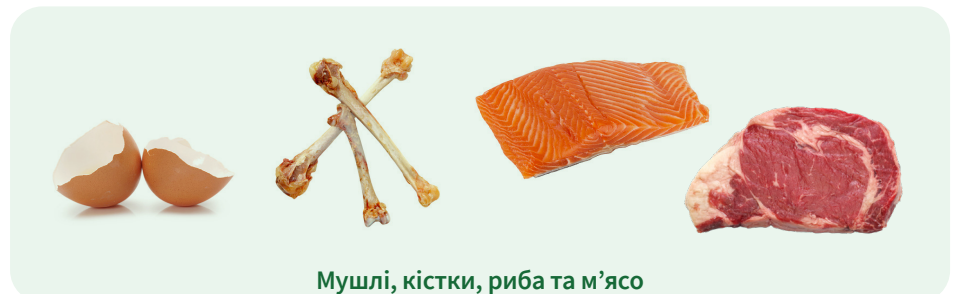
Мушлі, кістки, риба та м'ясо